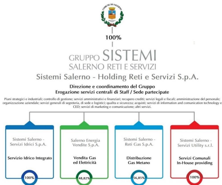
Tab. 1 – Rappresentazione grafica delle Società controllate e partecipate da Sistemi Salerno - Holding Reti e Servizi S.p.A.

Nel corso dell'ultima annualità non sono stati avviati procedimenti giudiziari a carico delle società del Gruppo Sistemi Salerno.