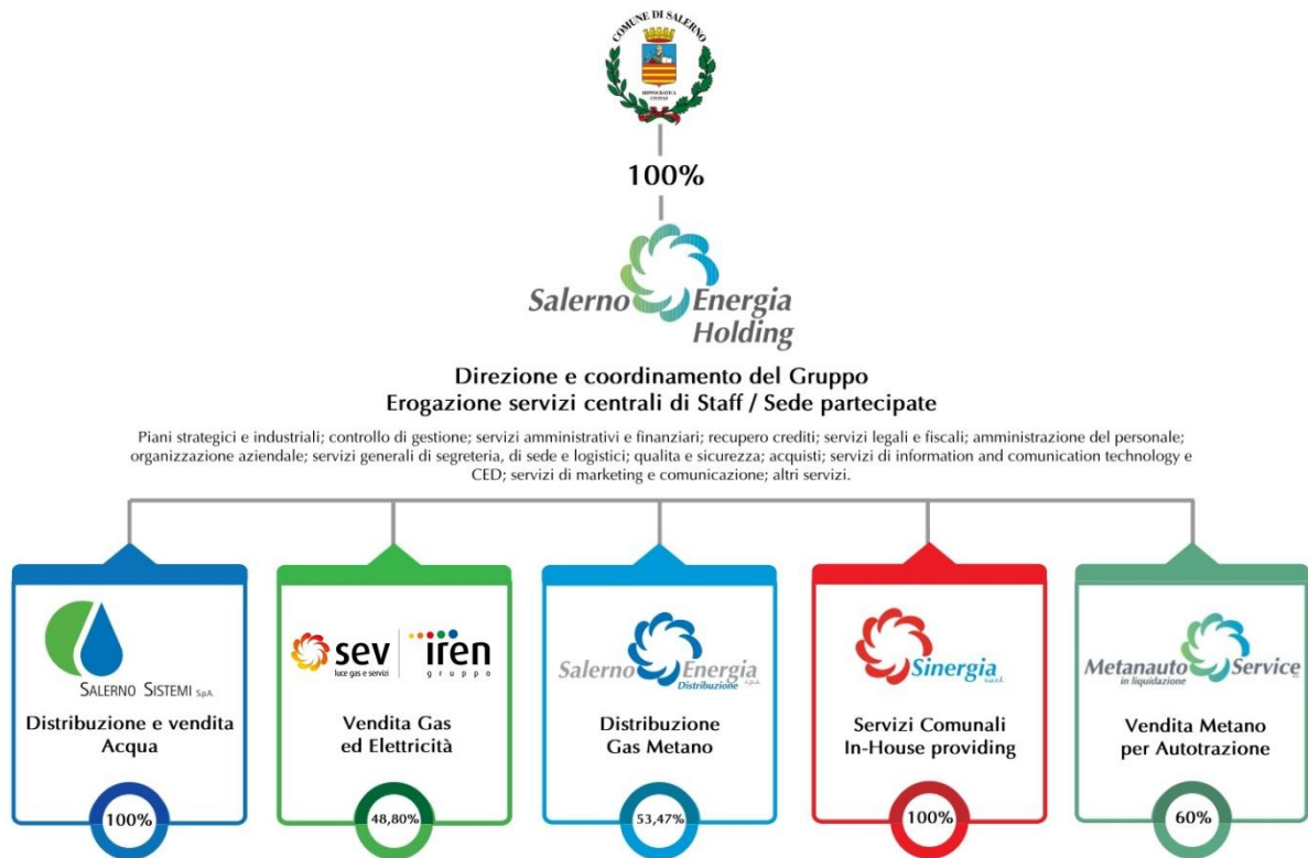
Tab. 1 – Rappresentazione grafica delle Società controllate e partecipate da Salerno Energia Holding S.p.A.